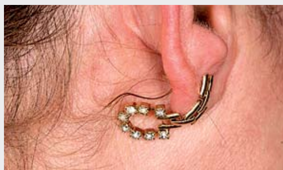
6. Manter o brinco na orelha por um mês para repitelização do túnel ao redor do eixo do adorno. ➤