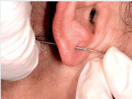
4. Encaixar a haste do brinco no bisel da agulha.