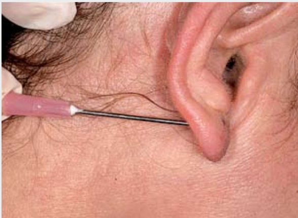
1. Aplicar anestésico tópico uma hora antes do procedimento.

O passo a passo de um procedimento simples que pode ser realizado por todos no dia-a-dia do consultório médico