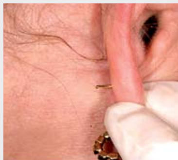
5. Fazer a movimentação retrógrada da agulha, posicionando o brinco no lóbulo.